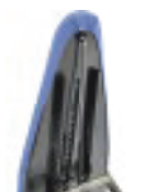
Molla a gas Gas spring