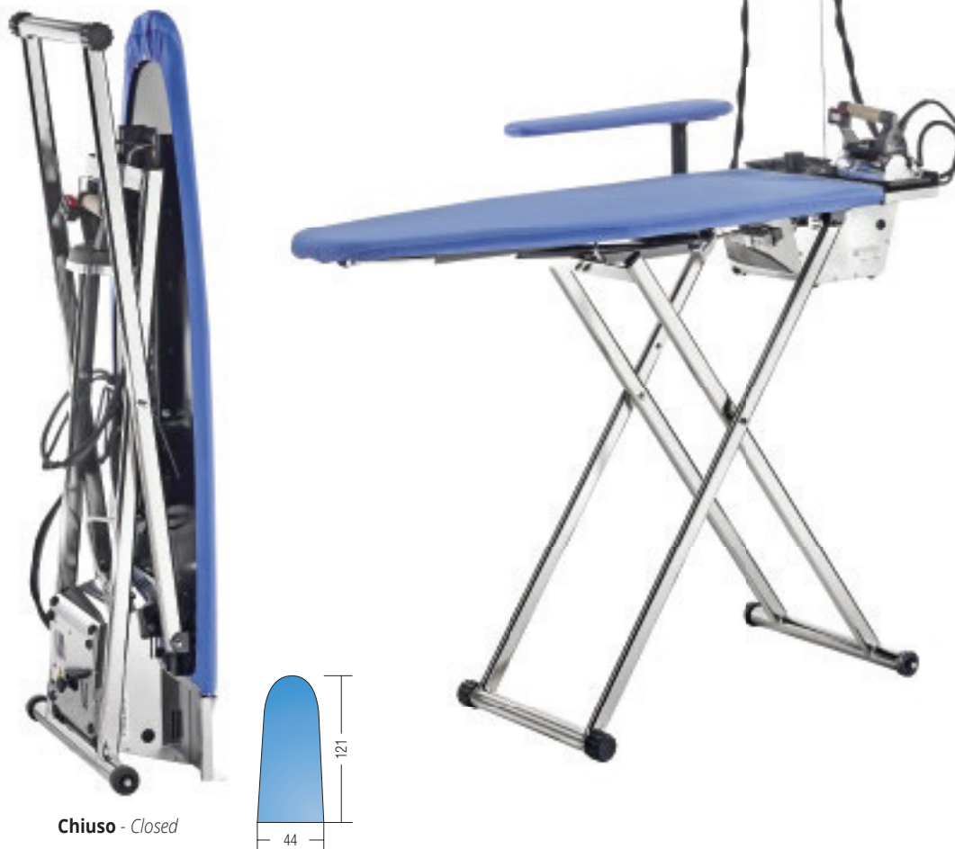
Chiuso - Closed

HEATED, VACUUM AND BLOWING FOLDABLE IRONING BOARD WITH IRON AND MANUAL OR AUTOMATIC STAINLESS STEEL BOILER