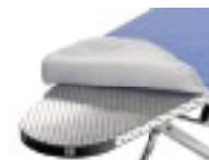
Piano stiro in alluminio Aluminium ironing board