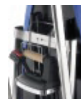
Supporto ferro Iron support